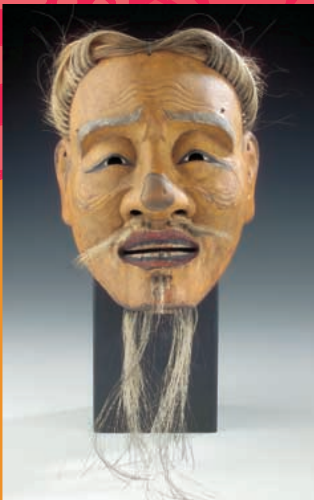
Masque de nô, de type sankôjô. Époque d'Edo (1603-1867) Cyprès polychrome et crin de cheval. Collection du Muséum.