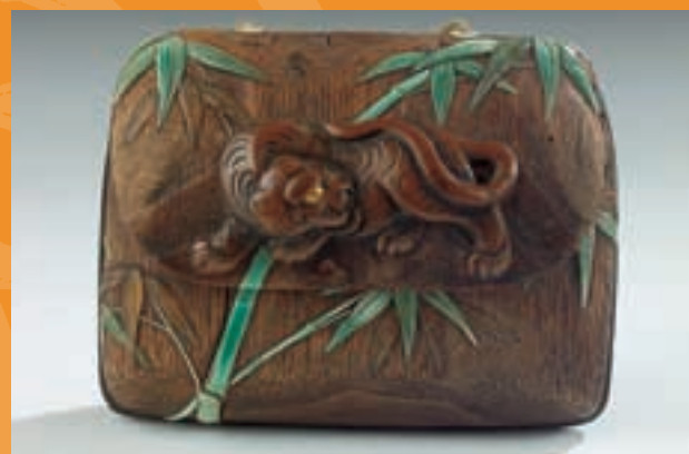
Blague à tabac ou tongkotsus

Il est déjà animé d'un esprit de recherche et d'une volonté de transmission qui feront de lui un précurseur de l'ethnologie orientale.