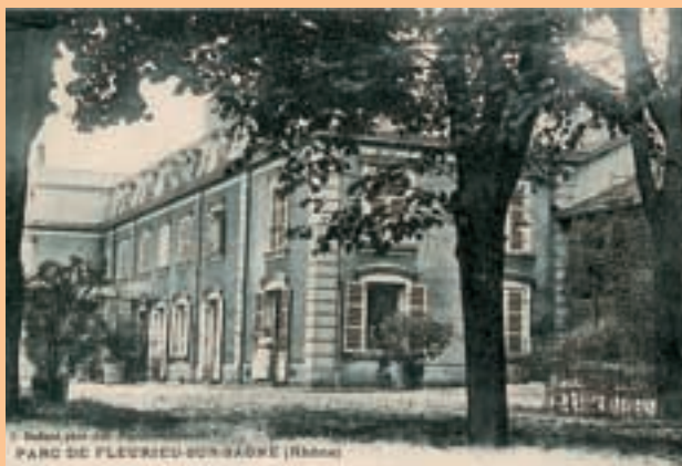
Maison d'Emile Guimet à Fleurieu-sur-Saône.

« Pour comprendre Bouddha, il faut se faire une âme Bouddhique. Mais comment y arriver par le seul contact des livres ou des collections ? C'est insuffisant... Il est indispensable de voyager » (Jubilé