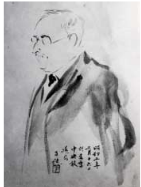
Paul Claudel Esquisse de Chine.

(1) Genre apparu au Japon au XVIIIe siècle, l' Ukiyo-e se caractérise par des représentations d'acteurs et de courtisanes, de scènes de la vie quotidienne et de vues de paysages célèbres.