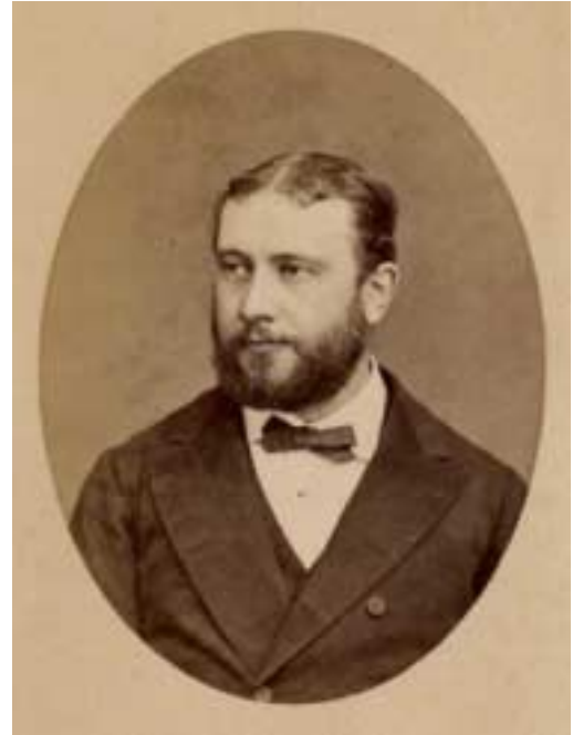
Émile Guimet.

Les voyages à l'étranger tiennent une place essentielle dans l'évolution d'Émile Guimet. Après un périple en Égypte, en 1865 il se plonge dans l'étude des religions anciennes et de la philosophie. Il se met aussi à collectionner des objets, des livres et même des momies. En 1868, il voyage notamment en Grèce, en Turquie et en Roumanie. Il adhère à la Société d'études japonaises et participe à des congrès d'orientalisme, d'anthropologie et d'archéologie préhistorique. En 1874, la visite de plusieurs musées à Copenhague le porte à s'interroger sur le rôle et la pédagogie des musées ethnographiques. Il envisage déjà de créer sa propre institution. Puis sa curiosité se focalise sur l'Asie et en 1876, mandaté par Jules Ferry, ministre de l'Instruction publique, il part au Japon, puis en Inde et en Chine pour enquêter sur les religions orientales. Il est accompagné du peintre Félix Régamey, auquel il a demandé de témoigner en images de leur périple.