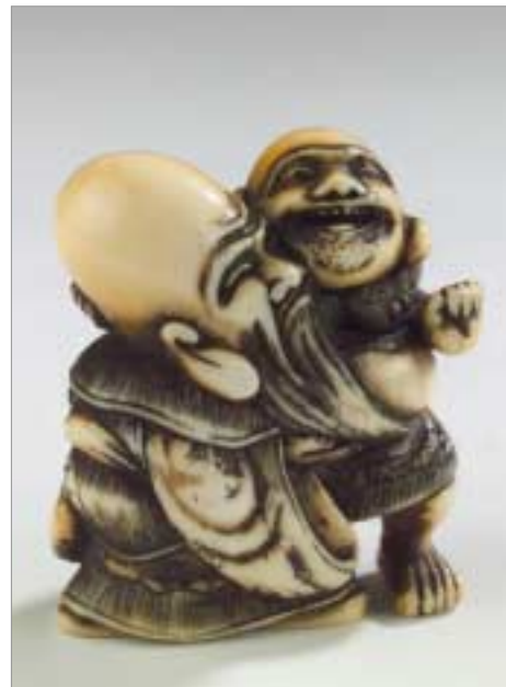
Parodie des luttes de sumo entre les dieux de bonne fortune, Hotei et Fukurokuju Netsuke - Période d'Edo, fin 18e siècle - Ivoire