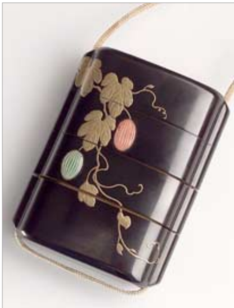
Boîte à médecine au décor de melon, inrô Période d'Edo (1772-1845) - Laque sur bois