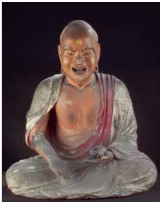
Portrait non identifié - Fin de l'époque Muromachi, époque Momoyama, 16ème siècle Bois laqué polychrome et yeux en cristal de roche incrusté

Extrait de « Des objets qui racontent l'Histoire, Culture du monde », R. Mourer, éd EMCC, Lyon, 2000