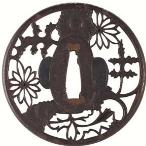
Garde de sabre, tsuba Epoque d'Edo - Fer ajouré et ciselé de chrysanthèmes

Extrait de « Des objets qui racontent l'Histoire, Culture du monde », R. Mourer, éd EMCC, Lyon, 2000